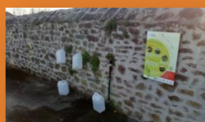
Affichage à Ambrières-les-Vallées

L'objectif de la gestion différenciée dans un cimetière consiste à concevoir cet espace comme un espace jardiné et faire en sorte que le végétal ne soit plus une contrainte mais, au contraire, un atout pour ce lieu public , par exemple par l'enherbement des allées, la mise en place de plantes couvre-sol, etc. Dans un contexte où la réglementation relative à l'usage des produits phytosanitaires est de plus en plus contraignante, les cimetières , avec les terrains de sports, sont souvent la dernière étape du « zéro phyto » pour les collectivités. La mise en œuvre