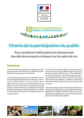
Charte de la participation du public

Ministère de la Transition écologique (2020)