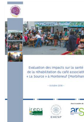
EIS réalisée dans le cadre de la mise en place d'un café associatif dans un village du Morbihan

Ecole des hautes études en santé publique (2020)