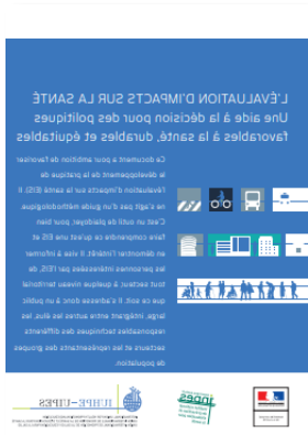
Dossier explicatif sur l'EIS