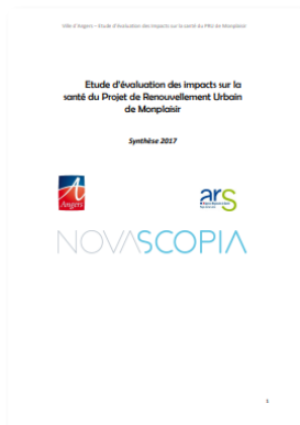
Présentation d'une EIS pour la ville d'Angers